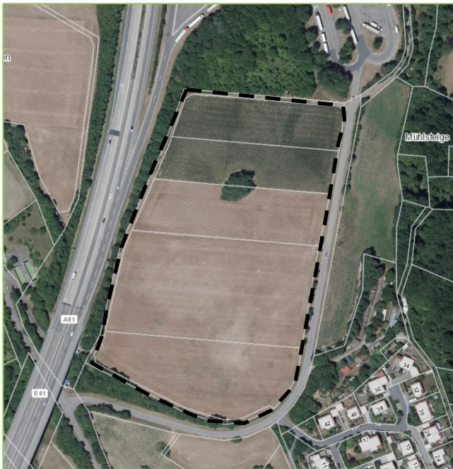
Abb. 7: Fläche A – „Löhren“ (M 1 : 5.000)