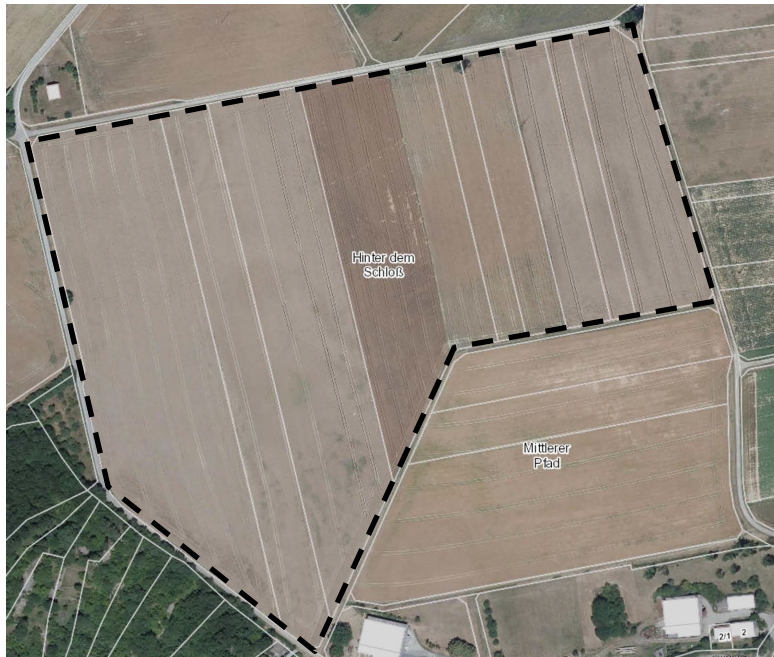
Abb. 6: Fläche F – „Hinter dem Schloss“ (M 1 : 5.000)