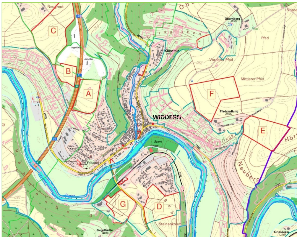
Abb. 1: Alternativ- flächen (M 1 : 20.000)