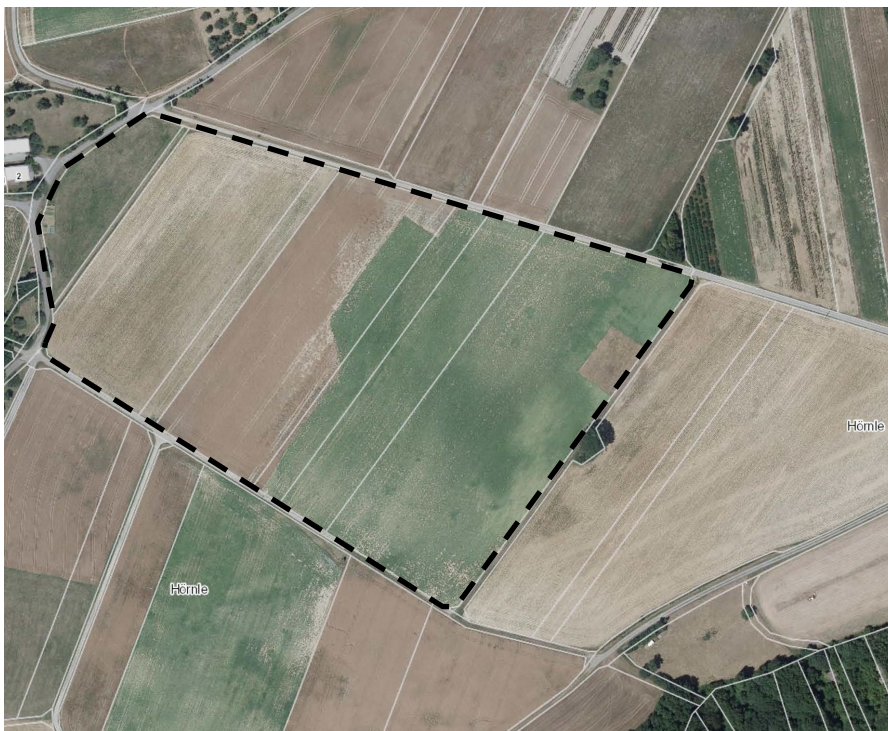
Abb. 5: Fläche E . „Hörnle“ (M 1 : 5.000)