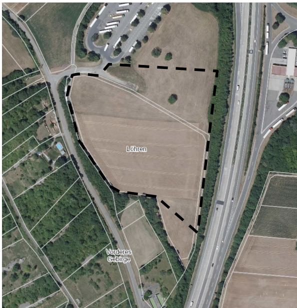
Abb. 2: Fläche „B“ – „Löhren West“ (M 1 : 5.000)