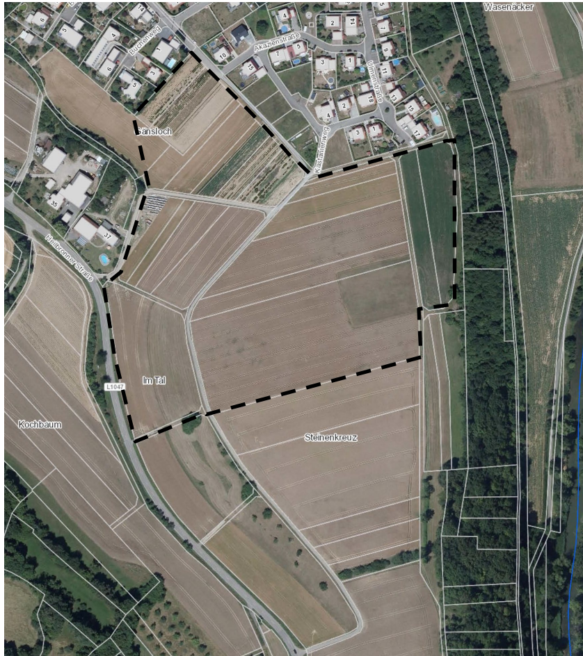
Abb. 4: Fläche D - „Steinenkreuz“ (M 1 : 5.000)